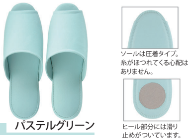
パステルグリーン