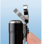
指1本で印面が現れるスライド式キャップレス。