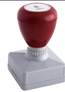
④ 35 × 35mm