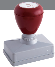
① 26 × 49mm