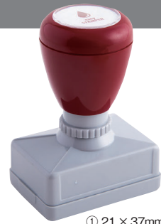
① 21 × 37mm

#123 aobaBldg 1-5-6 Oyaguchi Kitacho, aobaku, Tokyo 173-0031 Japan TEL03-1234-5678 FAX03-2345-6789