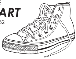
① 26 × 49mm