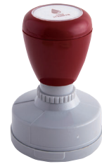
④ 直径 35mm