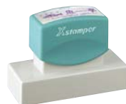
文字/角ゴシック(枠あり)