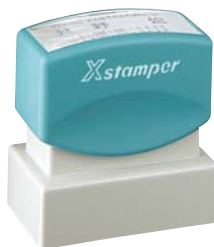
文字/角ゴシック・明朝(枠あり)